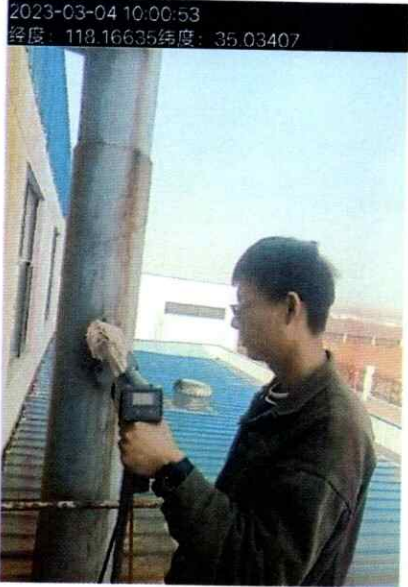
附图：临沂太合食品有限公司