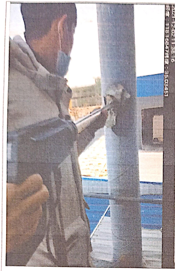
采样照片：（临沂太合食品有限公司）